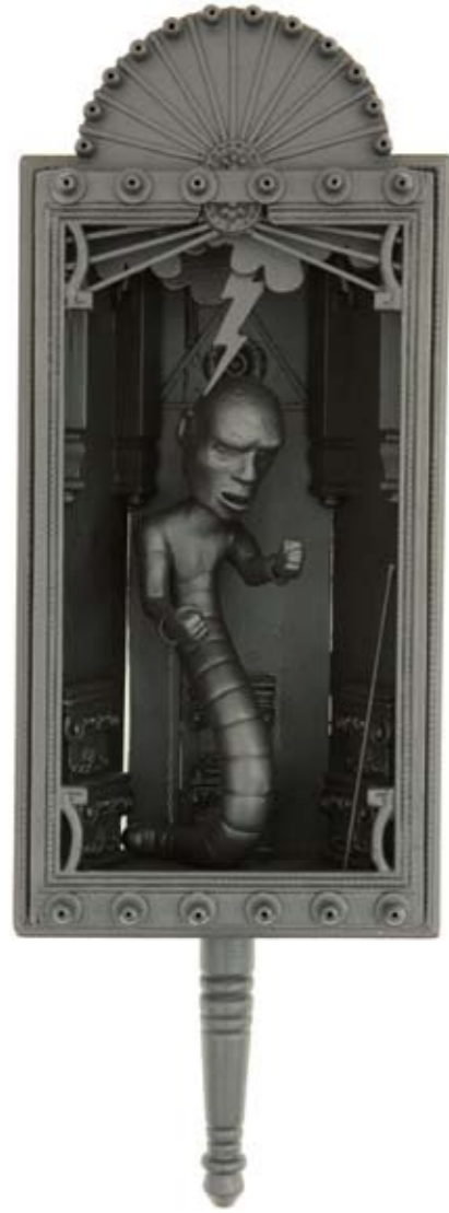
Liberation through divine intervention (2010) *