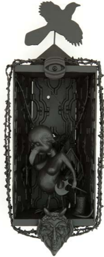
We are all worms.... (2010) *

(*for materials and size please look at the first picture)