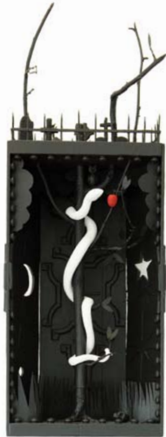
The serpent presents the seed of knowledge (2010) *