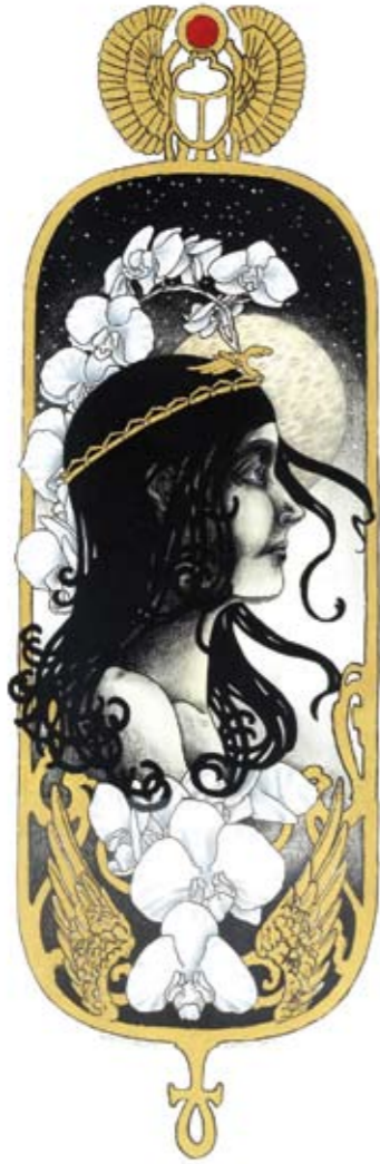
Ghost Orchid (2010) colored pencil, 28 x 64 cm