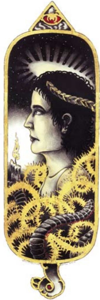
Resurrection (2010) colored pencil, 28 x 64 cm