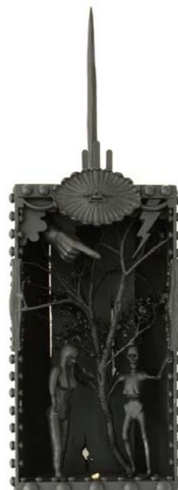
The consequence of conscience II – the expulsion of Eve (2010) *