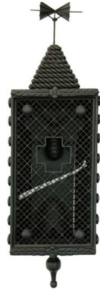
The sacrifice of one for many – calling all queens (2010) *