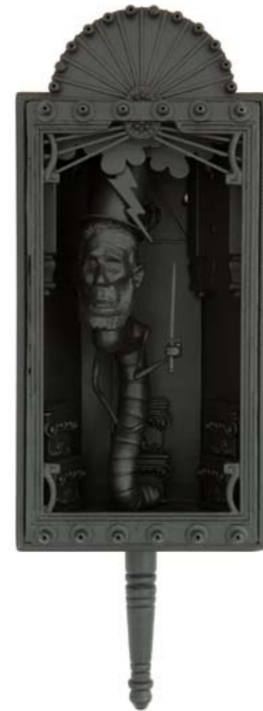
Abraham Lincoln holds the sword of righteousness (2010) *

(*for materials and size please look at the first picture)