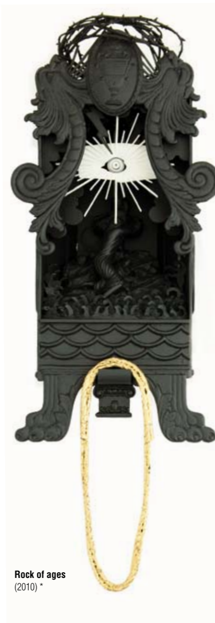
Rock of ages (2010) *