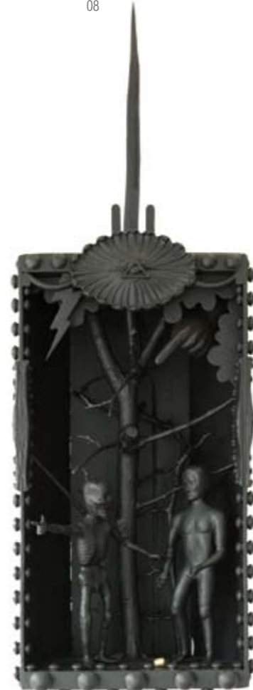
The consequence of conscience I – the expulsion of Adam (2010) *